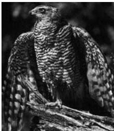
Vogelringstation GO8 BLAAUW coördinator Jac. Mussche

Tot zover onze "oogst", blijf uitzien naar die vogelpootjes, ze kunnen be-langrijk zijn.